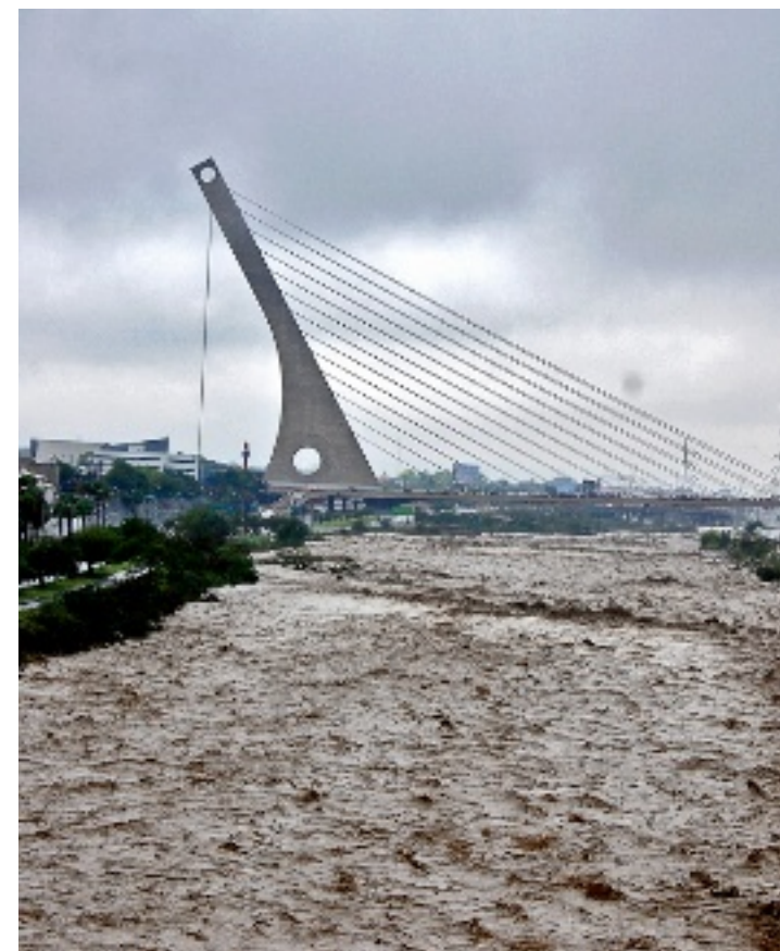
SANTA CATARINA SIN FIN Por Emma Purón