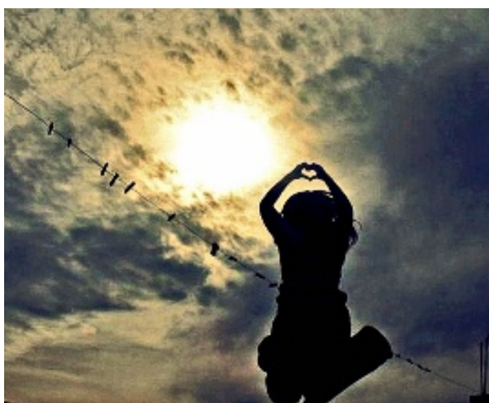
DANZA SOLAR Por Ana Ibarra