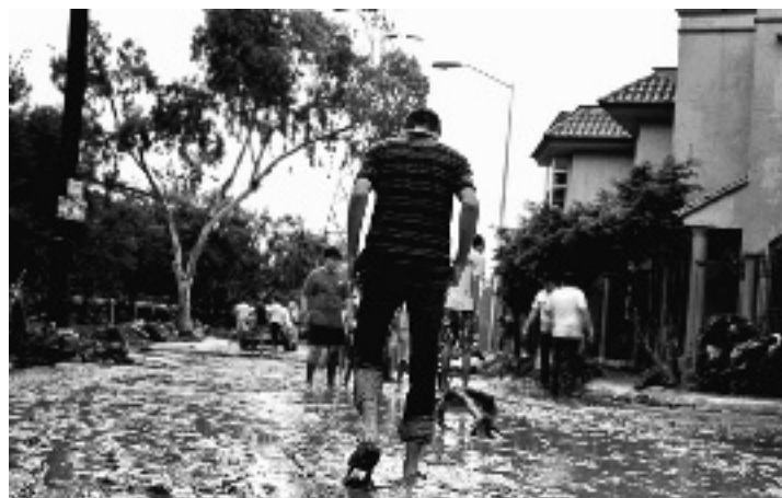
PASOS MOJADOS Por Celina Crespo